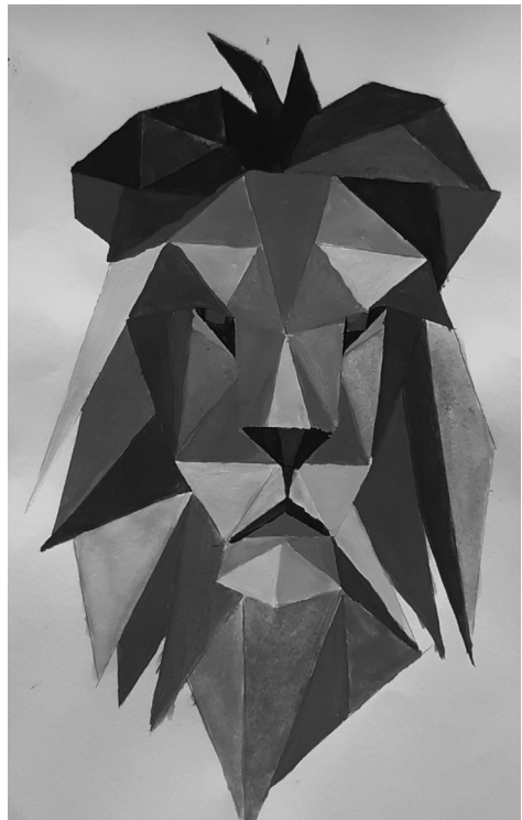
Els van Lankveld 1Va

Meer informatie over onze identiteit vindt u op onze website.