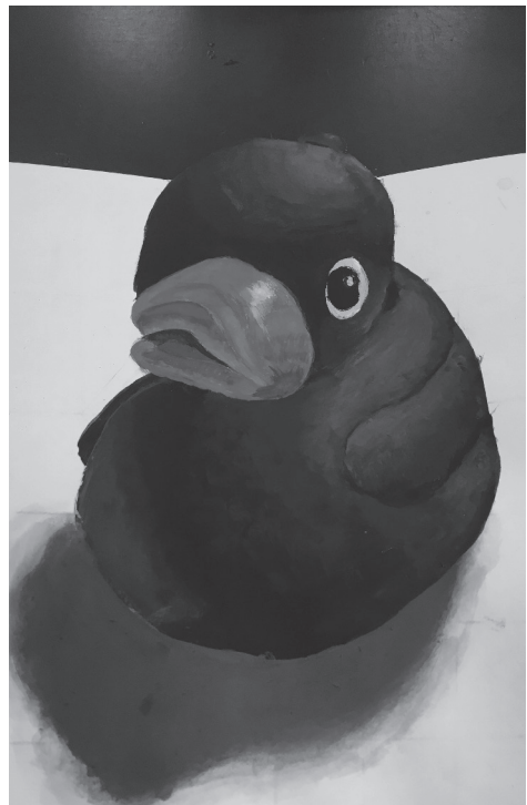
Nova Verbaarschot 3Hv